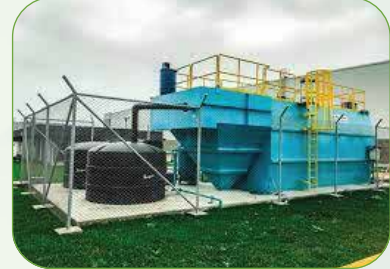
INDUSTRIAL PROCEE TRETMENT محطات المياه الصناعية