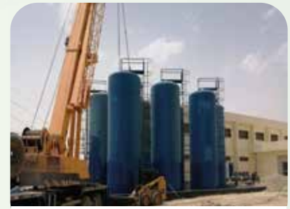
HAMMARING PROTECTION 18 M3 X 1 S.VESSEL

WARET HAMMARING SYSTEM COMPRESSED TYPE SURGE VESSEL : 60 M3 X7 TANK ANT-SLAMMING PUMPING STATION