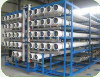
RO TREATMENT PLANT محطات التحلية