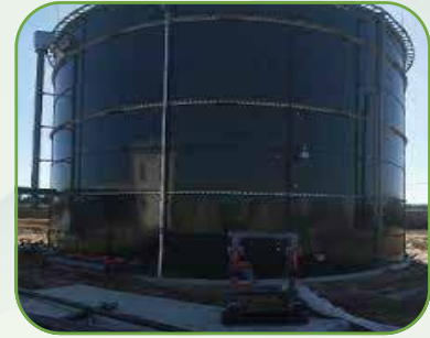
TANKS ERECTIONS (GLS/CS) بناء الخزانات بجميع أنواعها