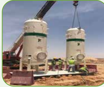
HAMMERING PROTECTION الحماية من المطرقة المائية