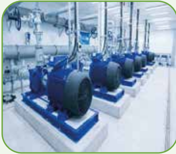
PUMPS STATION محطات الرفع السطحية والغاطسة