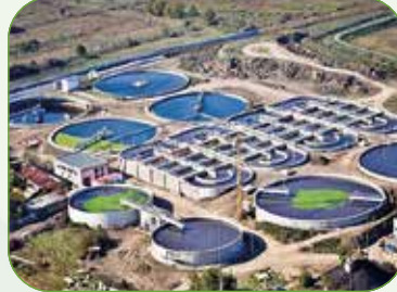
STP/ MBR/MBBR /SBR /GRAY محطات الصرف الصحي